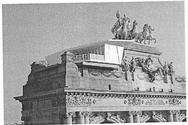
The Cube by Electrolux à Bruxelles.

pas œuvre par la déclaration de son auteur. Ni par le dépôt. L'enveloppe Soleau est juste une preuve qu'à telle date l'artiste revendiquait telle œuvre.